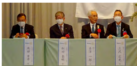
特別出席者の皆様