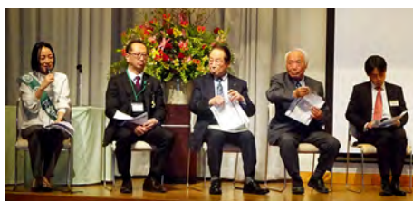
「会員セミナー」パネラーの皆様