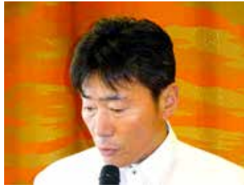
・原一馬親睦活動・友好委員長