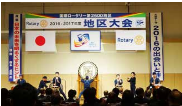
アトラクション 龍神太鼓