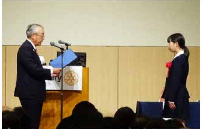
RI会長賞受賞 伊那西高等学校インターアクトクラブ