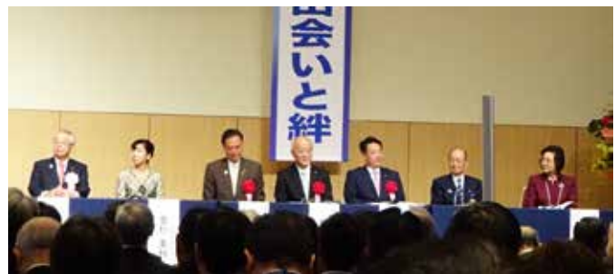
ご来賓・特別出席者各位