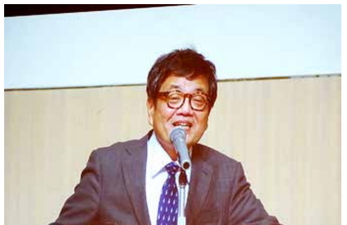
記念講演 森永卓郎氏