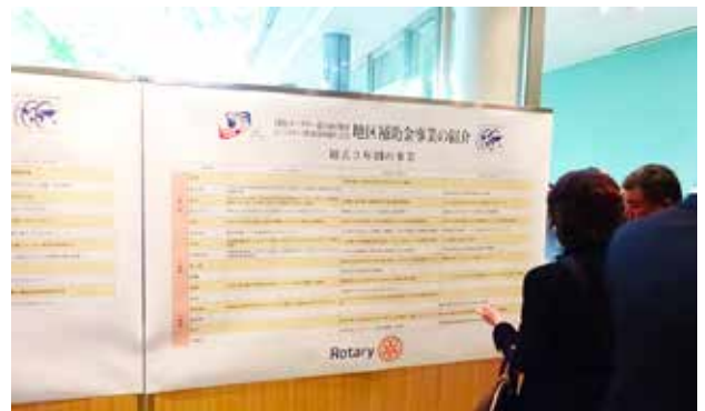
地区補助金事業紹介パネル