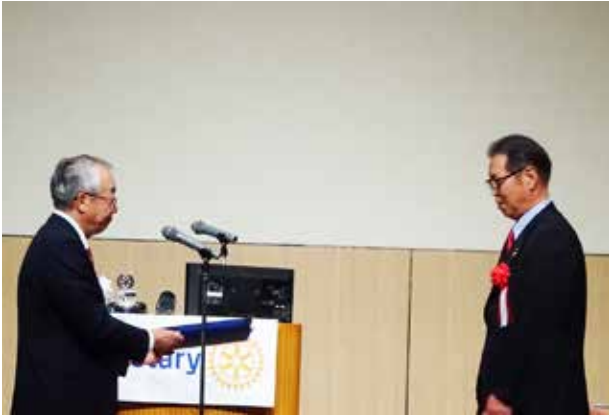
RI会長賞受賞・会員増強賞受賞 伊那中央ロータリークラブ