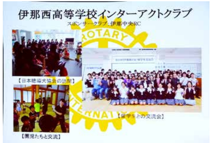
インターアクトクラブ・ロータリーアクトクラブ活動紹介パネル