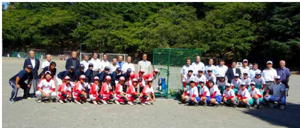
●バッティングマシン試し打ち他 交流 ～10:00 終了 ⇒例会場へ移動して通常例会