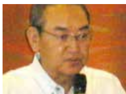
・鈴木一比古 ロータリー財団委員長