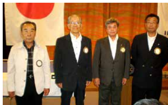
緊張と安堵のバトンタッチ