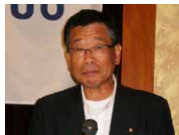
池上幹事初の幹事報告